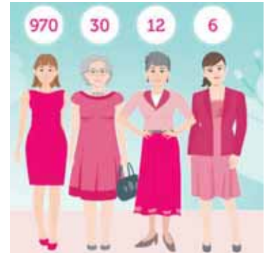
Für die meisten Beruhigung, für Betroffene rechtzeitige Hilfe: Mammographie.

Das Mammographie-Screening Programm zeichnet sich durch moderne Technik, tägliche Qualitätssicherungsmaßnahmen sowie hoch qualifiziertes Personal und unabhängige Doppelbefundung aus. Die Mammographie ist für eine bevölkerungsweite Untersuchung für Frauen zwischen 50 und 69