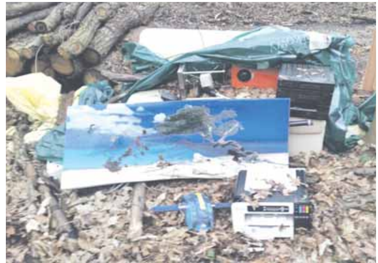
Zweckentfremdet: Hier wird der Wald zur Müllhalde „umgenutzt“. Wer erkennt Gegenstände auf diesem Bild?