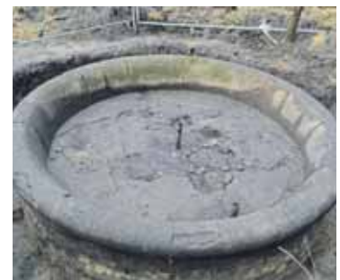
Wiederentdeckt: Der Brunnen, um den einst die Kaiserin wandelte.

Die Villa der Familie Bluth wurde 1945 bei der Sprengung des Bahnhofsgebäudes zerstört, der wunderschöne Garten verfiel. In dem verwilderten Stück des ehemaligen Gartens entlang der Bahntrasse wurde dann später vom Bauhof der Gemeinde Fredersdorf-Vogelsdorf nach einem Hinweis ein Brunnen ausgegraben. Zunächst nahm man an, es handle sich um den Bohmschen Brunnen, der bis in die 1970er Jahre vor dem Rathaus stand (siehe Ortsblatt vom 16. September 2017). Doch es war offensichtlich der Brunnen, der einstmals im Garten der Familie Bluth stand und um den die letzte deutsche Kaiserin 1916 gewandelt war. Wer weiß, vielleicht kommt doch noch einmal der Tag, an dem