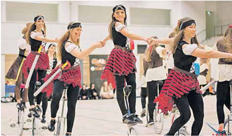
Mit Silbermedaille: Die Großgruppe aus 20 Teilnehmerinnen zeigte eine Kür zum Sound von „Fluch der Karibik“.

Große Erfolge bei den ostdeutschen Kürmeisterschaften und Begegnung mit Handballern