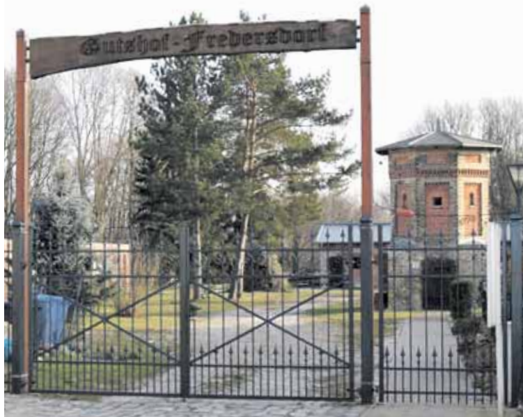
Blockiert: Eingeplante Mittel für Baumaßnahmen am Gutshof wurden nicht freigegeben, Gelder für den weiteren Ausbau abgelehnt.

Die Emotionen in der ersten Sitzung 2018 entzündeten sich vorerst jedoch an einem Thema, das in die entgegengesetzte Richtung wies: Zu Mehrausgaben. Grundlage war ein einstimmiger Beschluss der vorherigen Gemeindevertretung im Februar 2014, den Gutshof in der Ernst-Thälmann-Straße zu einem Begegnungszentrum zu entwickeln. Zu diesem Zwecke wurden 273.000 Euro in den Haushalt des Jahres 2018 eingestellt. Zweckgebunden, um die Standsicherheit und die Wiederherstellung der baulichen Hülle des denkmalgeschützten Gutshofgebäudes zu ermöglichen. Allerdings ist diese Summe mit einem