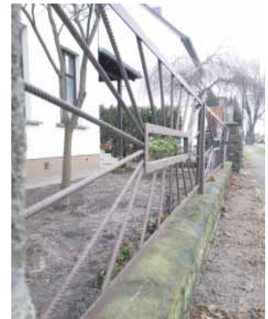
1973 von Manfred Arndt gebaut: Zaun in der Langen Straße.

Daher wird es jetzt im Februar eine erneute Haushaltsdebatte geben.