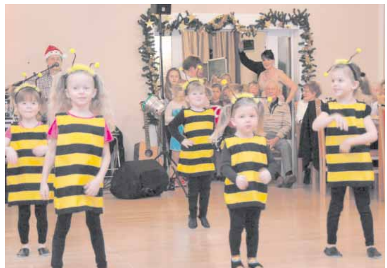
Bezauberten die Gäste der Seniorenweihnachtsfeier: Die kleinen Tanzmäuse vom TSV Fredersdorf.