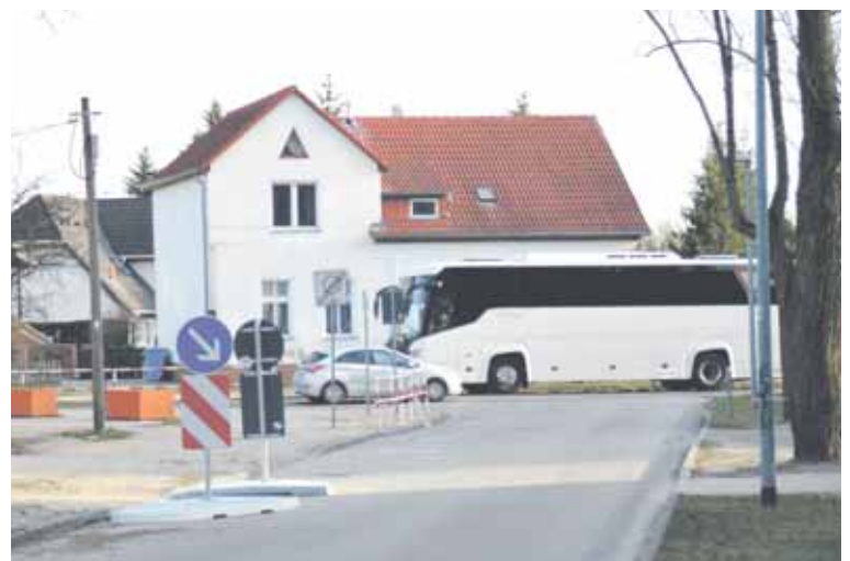
Sichere Querung: Kinder sollen dank dieser Verkehrsinsel in der Gartenstraße mit weniger Risiko zu Fuß unterwegs sein.