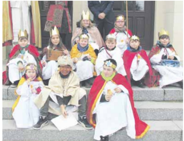
Gesammelt und gesegnet: Kurz nach Jahresbeginn besuchten die Sternensinger das Rathaus von Fredersdorf-Vogelsdorf.

Finanziell unterstützt wird das groß angelegte Projekt mit Mitteln des Bundes und des Landes Berlin im Rahmen der sogenannten Gemeinschaftsaufgabe zur „Verbesserung der regionalen Wirtschaftsstruktur“.