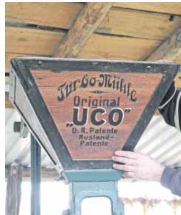
Sieht aus wie anno dunnemals: Die Turbo-Mühle gehört zu den besten Stücken der Sammlung.

Teil so um, dass er es künftig transportieren kann. Denn er möchte die alten Geräte und Maschinen in Aktion präsentieren. Also stabilisiert er den Unterbau.