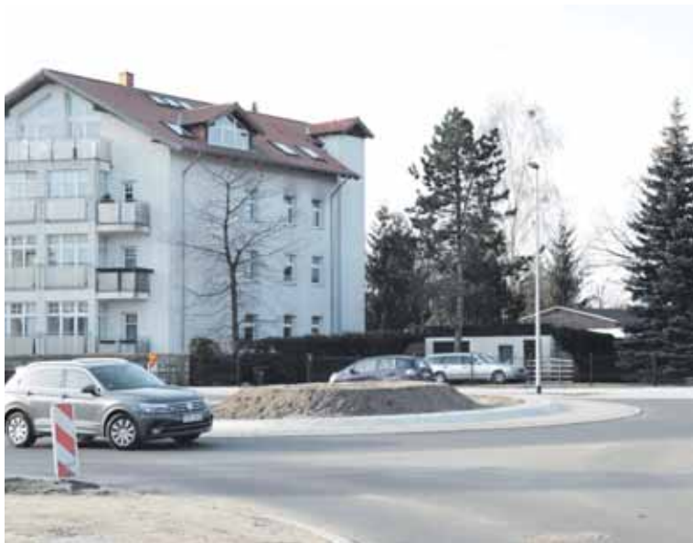
Der Verkehr rollt: Pünktlich wurde der Kreisverkehr Altlandsberger Chaussee, Lindenallee und Arndtstraße freigegeben.