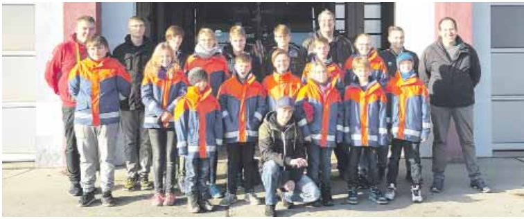
Unvergesslicher Tag in der Hauptstadt: Mitglieder und Betreuer team der Jugendfeuerwehr hatten aufregende Erlebnisse in Berlin.