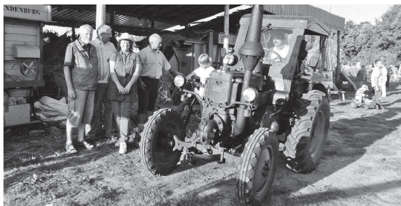
Reges Interesse herrschte bei der Vorführung der alten Technik

(wt) Am Samstag und Sonntag luden die Freunde alter Landtechnik zu einem Feldnachmittag in Fredersdorf Nord ein. Die Veranstaltung gestaltete sich insbesondere für Familien mit Kindern zu einem Höhepunkt, denn die beliebten Treckerfahrten um den Acker und die Arbeit auf einem Minibagger hatten es den Kleinen angetan. Viele Hebel und Schalter waren zu bedienen, um einen Reifenstapel von einem Ort an den anderen zu befördern. Das Interesse der Kinder und Erwachsenen richtete sich naturgemäß auf die alte Technik. Es ist immer wieder erstaunlich, wie gut erhalten und funktionell sie ist. So wurden ein Dreschkasten Kramer und ein Lanz Bulldog, beide aus dem Jahre 1936,