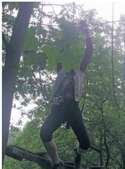
Die persönlichen physischen Grenzen testen. Eine extreme Herausforderung für Körper und Geist.

Seit Anfang des Schuljahres beschäftigen wir, die Schüler der 8. Klassen der Oberschule Fredersdorf, uns im LER-Unterricht mit dem Thema „Angst und Mut“. Wir sprachen darüber, dass es völlig normal ist, manchmal Angst zu haben, über „Mutproben“ oder über Menschen, die in schwierigen Situationen viel Mut zeigten, wie z. B. die Geschwister Scholl. Das alles war durchaus interessant, aber irgendwie doch sehr theoretisch. Und dann hatten unsere Lehrer eine tolle Idee: im Kletterpark Strausberg sollten wir selbst unsere Angst überwinden und Mut zeigen. Am letzten Schultag vor den Herbstferien war es dann endlich soweit. Um es kurz zu machen: wir, die Schüler, stellten uns alle der Herausforderung! Bei unseren Lehrern sah das schon anders aus: sie zogen es vor, unsere „Heldentaten“ vom sicheren Boden aus zu beobachten. Ehrlich gesagt, das Überwinden unserer Angst war nicht wirklich das Problem, eher das Durchhaltevermögen. Aber wirklich: 3 Stunden Klettern ist auch ziemlich viel verlangt von unseren durch die Pubertät geschwächten Körpern! Es war ein tolles Erlebnis und wir sind schon gespannt, was sich unsere Lehrer als Nächstes einfallen lassen werden.