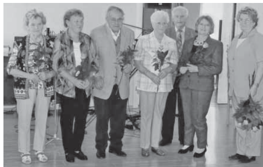
Die Geburtstagskinder des Monats September

Beide verstanden es bestens, allen ihre persönlichen Erlebnisse mit den schönen Landschaftsbildern nahe zu bringen. Ganz im Zeichen der deutsch-französischen Freund-