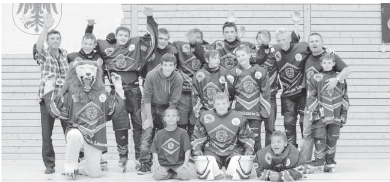
Die Brandenburgmeister aus Fredersdorf-Vogelsdorf: Inline-Hockey-Club „Märkische Löwen“

IHC Märkische Löwen fährt zu Deutschen Jugendmeisterschaften