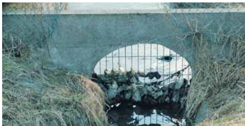
Dieser extrem verunreinigte Durchlauf an der Bahnhofstraße - Verdriesstraße kann so nicht mehr seine Aufgabe, den Abfluss des Wassers erfüllen.

Bodenflächen wurden versiegelt und der für die Verdunstung so wichtige Baumbestand nahm stark ab. Außerdem wurden die Pflege