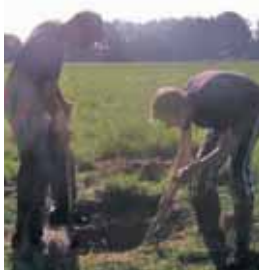
Die eigenen physischen Grenzen testen. Eine Herausforderung für Körper und Geist.

Bericht über eine Exkursion der 10. Klasse