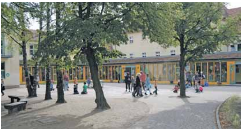
Nach den Wettkampfspielen ging es eher beschaulich auf dem Herbstfest zu.

Der Hort der Vier-Jahreszeiten Grundschule feierte