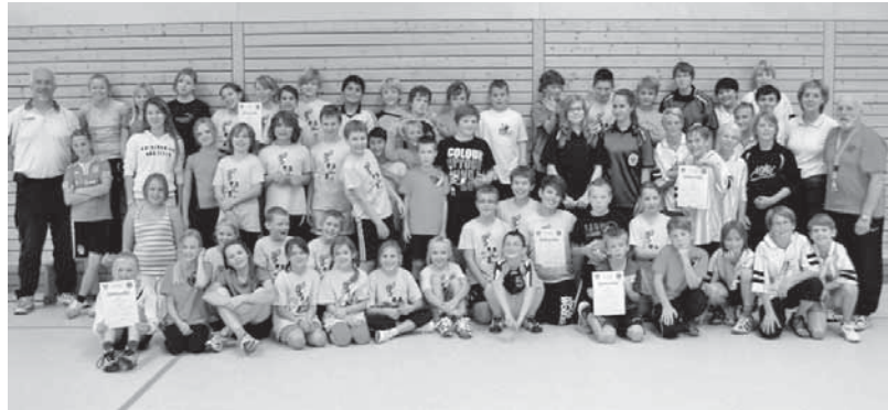
Die teilnehmenden Handball-Schulsportmannschaften

1. Fallada Grundschule Neuenhagen: 34:16/4:0